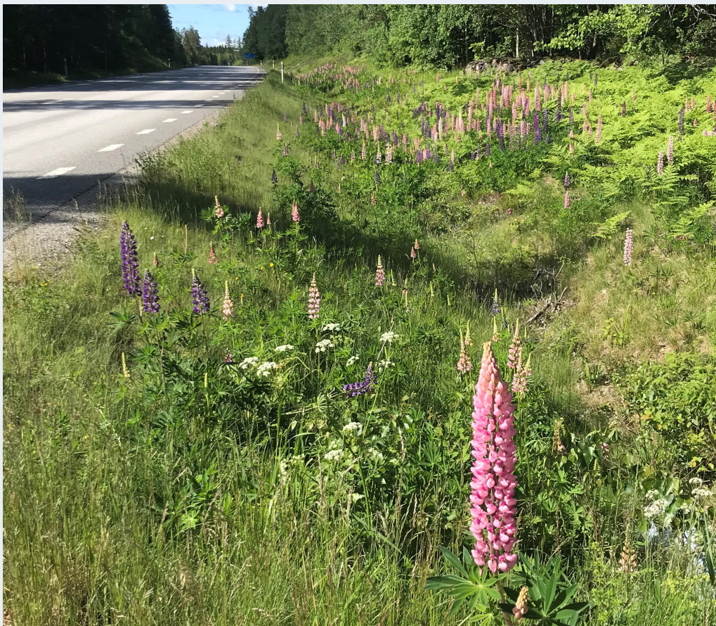
FIGUR 1. Blomsterlupin Lupinus polyphyllus längs riksväg 68. Morskoga, 15 juni 2021.

Blomsterlupin är en storvuxen och konkurrenskraftig växt. Plantorna skuggar och täcker andra mindre och svagväxande arter, och den gödslar marken via sin kvävefixering vilket ytterligare missgynnar konkurrenssvaga växter (Valtonen m fl 2006, Ramula & Pihlaja 2012, Hansen m fl 2021, Knudsen 2021). Farhågor finns även att den konkurrerar med andra växter om pollinatörer (Valtonen m fl 2006).