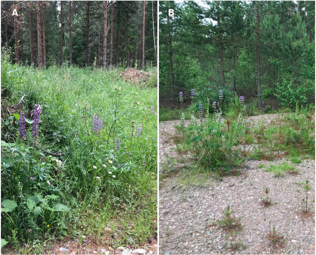
FIGUR 4. (A) Mindre och isolerad lupinförekomst på hög med matjord avlagda vid slutet av en mindre väg, Morskoga respektive (B) på ett nyanlagt virkesupplag med sprängstensmassor vid Hedbyheden. FOTO: Jan Olof Helldin, 23 juni 2021.

redan idag utgör ett problem för den lokala floran.