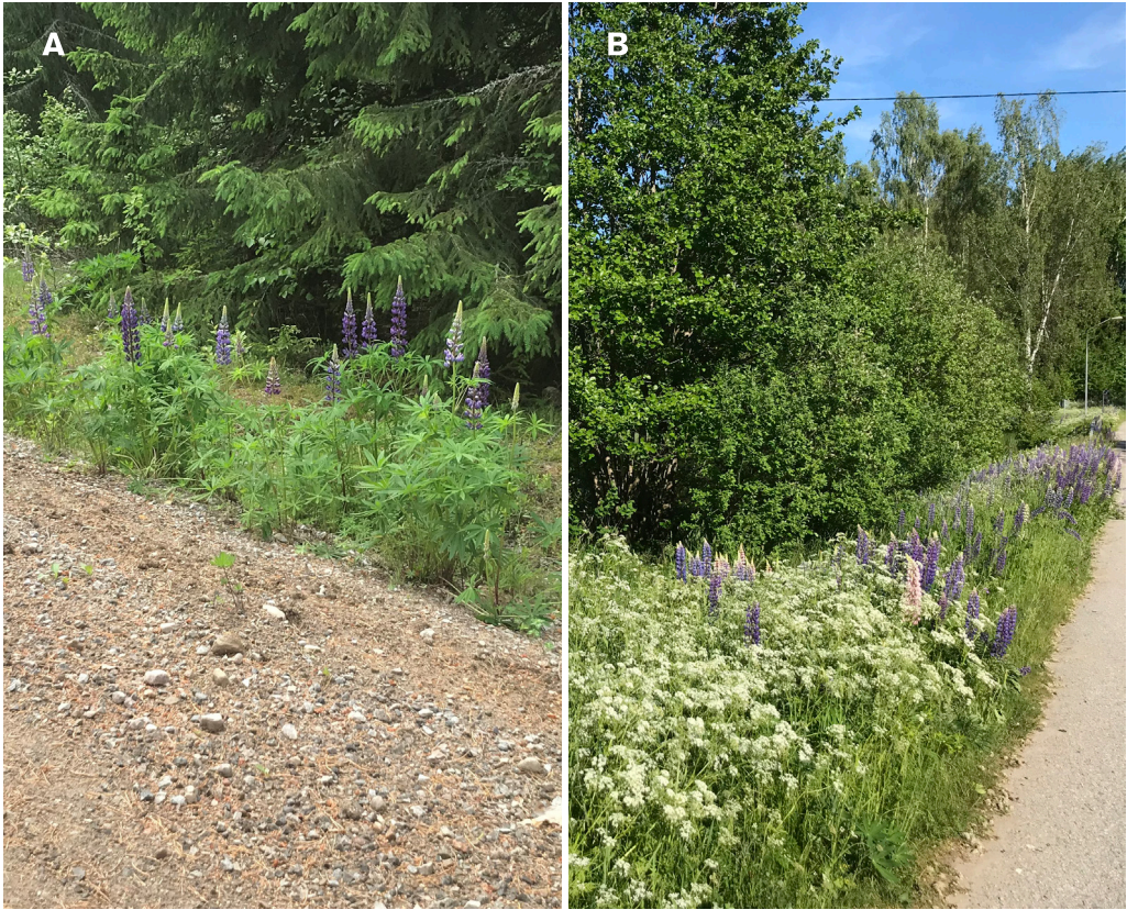
FIGUR 3. (A) Spridningen av lupiner från väggkanten in i omgivande terräng är oftast begränsad, särskilt i skogsmiljö. (B) Lupiner förekommer mest i vägområdet och har bara i undantagsfall spridit sig in i omgivande miljöer. länsväg 847 samt byväg vid Grönbo, 23 juni 2021.

var uteslutande vid gårdar eller ruderatmiljöer, vilket antyder att dessa kan ha utgjort spridningskällor in till väggkanten snarare än tvärtom, alternativt att sådana anlagda miljöer är mer mottagliga för lupininvasion än naturmark.